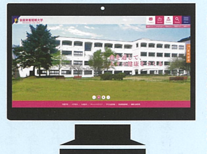
パソコンでの表示

このたび、秋田栄養短大のホームページをリニューアルします。今回のポイントは、スマートフォンやタブレットPCなどの携帯端末での閲覧の際にも、画面サイズに応じた表示で利用いただけるデザインです。 ホームページは、基本カラーをピンクとし、同色の濃淡で各ページを構成しています。 また、メニュー、掲載する内容を見直し、閲覧する端末を問わずクリックしやすいボタンを配置して、これまで以上に必要な情報が探しやすいくなります。