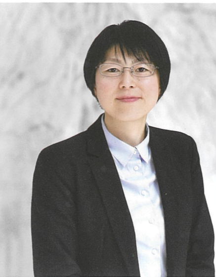
盛岡大学【管理栄養士】勤務