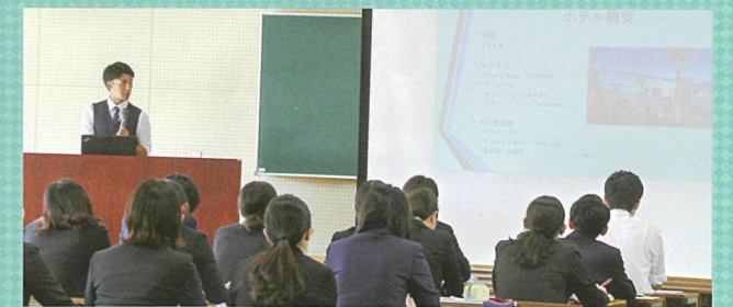
インターンシップの体験報告会

一方で、国際観光学科の担当教員は「国内・海外のインターンシップでは、最長で1ヶ月間の就業体験ができます。私たちは、この機会を就職活動・社会人への助走と捉えています。学生の成長や企業との適性、働き方などを考えて、一人ひとりと面談し